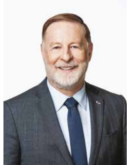
Marc Demers Maire de Laval

Porteur d'une vision inspirante, ce plan marque un virage. Les prochaines années témoigneront de notre engagement envers la culture, véritable catalyseur pour nourrir la fierté d'être Lavallois et renforcer le statut de Laval, 3 e grande ville du Québec.